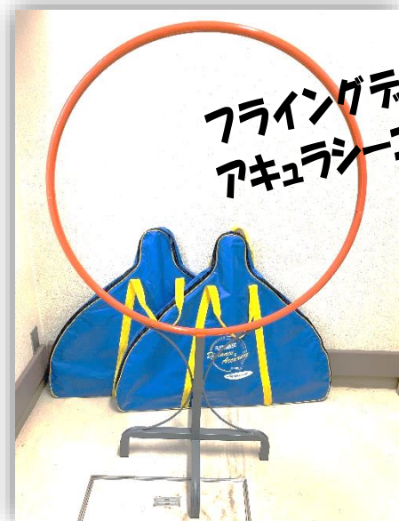
フライングディスク アキュラシーゴール

山梨県障害者福祉協会 障害者スポーツ担当 〒400-0005 甲府市北新 1-2-12 福祉プラザ1F TEL 055-252-0100 FAX 055-251-3344 E-mail kita@sanshoukyou.net ホームページ info@sanahoukyou.net