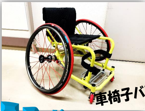
車椅子バスケット車