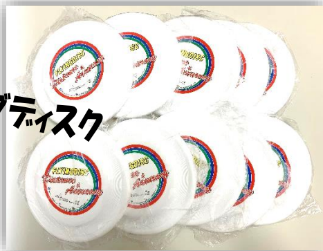
フライングディスク