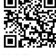
障害者福祉協ホームページ